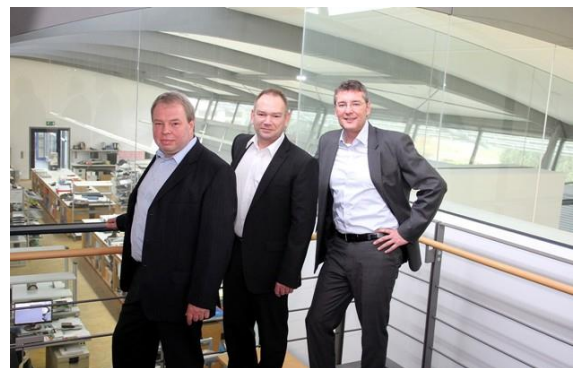
Das Team von Activoris freut sich ebenfalls über das Erreichen des Investment-Ziels.

Die Crowdfunding-Plattform aescuvest sucht Sponsoren für innovative Produkte und Unternehmen in der Medizintechnik. Bevor ein neues Unternehmen dafür ausgewählt wird, durchläuft es eine Prüfung durch den wissenschaftlichen Beirat. Als eine der ersten Crowdfunding-Plattformen überhaupt erfüllt es zudem die Anforderungen, die sich aus dem neuen Kleinanlegerschutzgesetz für Crowdfunding-Unternehmen ergeben.